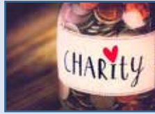
বিশেষজ্ঞ দাতব্য প্রতিষ্ঠান